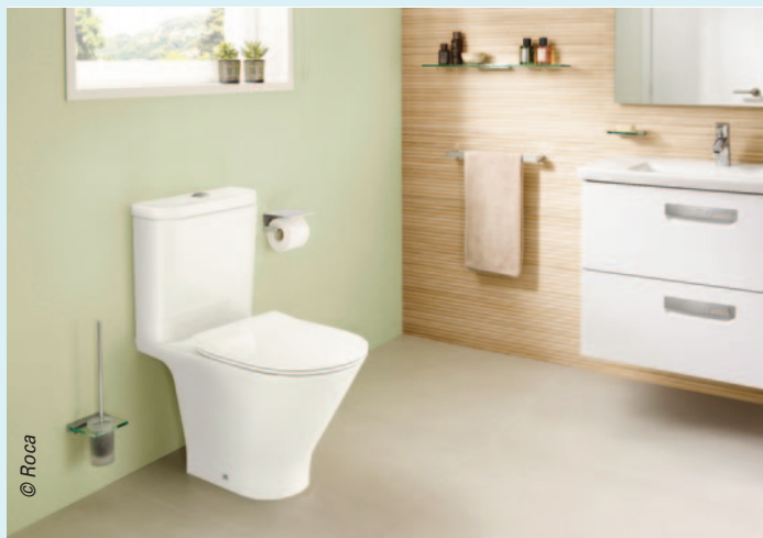
Le WC The Gap Round de Roca, caréné et sans bride, existe en version suspendue ou à poser. Il est équipé d'un abattant slim (en Urea) à frein de chute, déclinable.