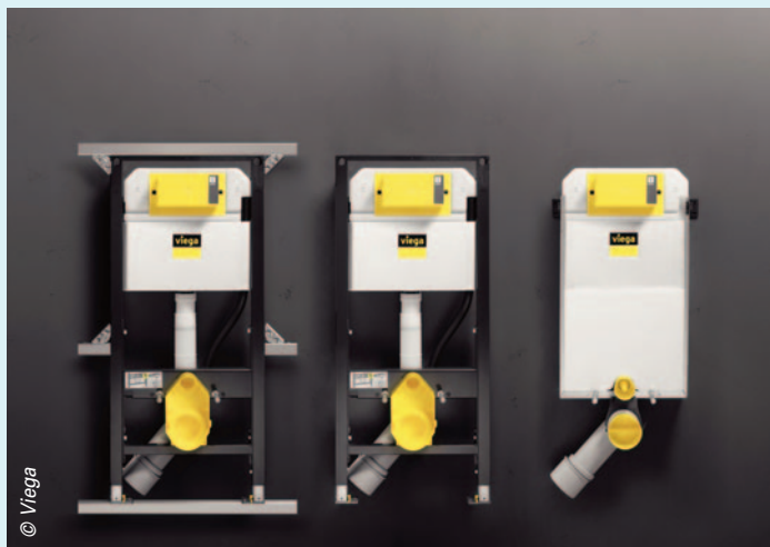
Le bâti-support ViEGA Prevista, conçu avec des installateurs, se monte à l'aide de trois outils (règle, niveau à bulle, clé de 13). Trois modèles (bâti à monter sur rails, bâti universel, bâti autoportant, réservoir seul). Régulateur de débit, 50 plaques adaptables, hauteur cuvette ajustable sur 6 cm.