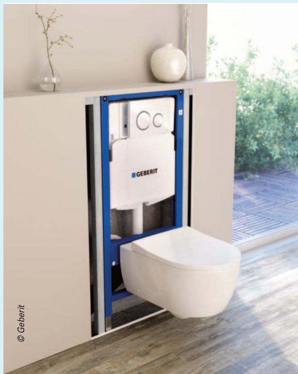
Le Bâti-Pack WC suspendu Sigma Renova de Geberit inclut un bâti-support autoportant Duofix (12 cm), les accessoires nécessaires à sa pose, une cuvette Rimfree à fixation cachée, un abattant déclinable à frein de chute et une plaque de commande Sigma (blanc ou blanc chromé). En option, l'absorption des odeurs.