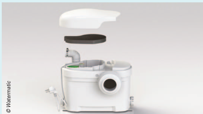
Le broyeur adaptable W15SP Silence de Watermatic est à la fois discret, grâce à un moteur et à une cuve insonorisés, et permet de raccorder deux autres appareils (lavabo, douche ou évier), malgré sa compacité. La version WP30SP Silence assure le raccordement d'une cuvette seule.