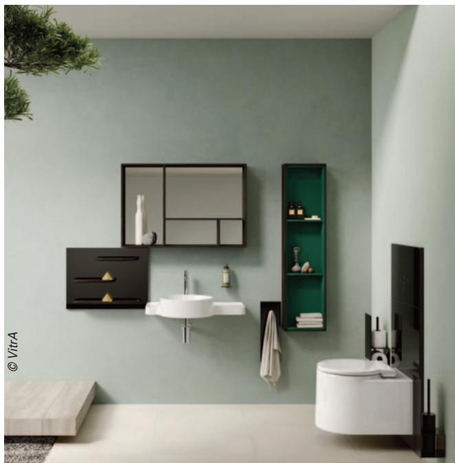
La collection Voyage de Vitra, modulaire et flexible, prévoit l'aménagement des toilettes, grâce à des meubles de profondeur réduite, composable à la verticale et à l'horizontale.

La cuvette WC, qui porte depuis plusieurs années les ventes de céramique sanitaire en France, évolue sans rupture, ni tout à fait la même ni vraiment différente... Le point sur les tendances et les dernières nouveautés.