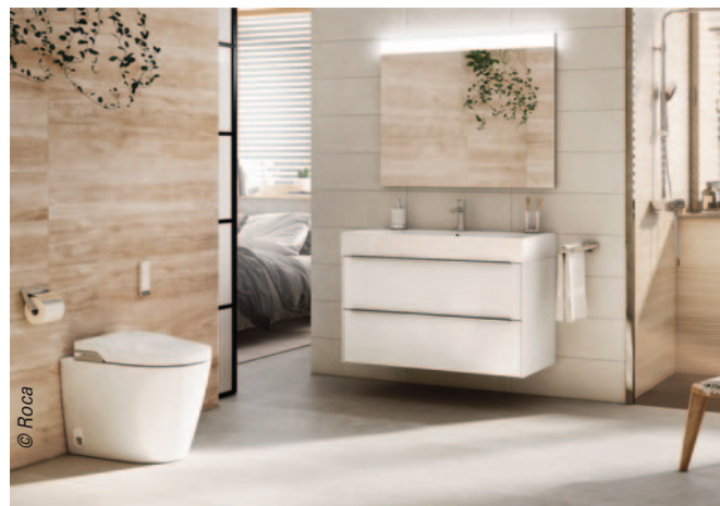
Multifonction, le WC lavant In Wash + In Tank de Roca intègre son propre réservoir de chasse, dans un double fond. Lavant, il dispose de la plupart des fonctions disponibles aujourd'hui (séchage...).