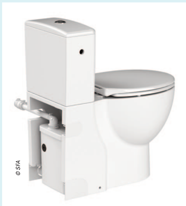
Le WC Saniflush de SFA combine un WC classique et un WC broyeur. Équipé d'un réservoir et d'une double chasse, son broyeur est totalement intégré, donc invisible, et son design consensuel. Le niveau sonore est également réduit.