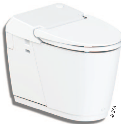
Léger, le WC broyeur Sanismart de SFA est facile à manipuler car 40 % plus léger qu'un modèle en céramique. Deux trappes latérales facilitent l'accès aux éléments techniques.

Quant à l'objet lui-même, il n'évolue que lentement. Depuis l'arrivée des cuvettes sans bride, pas de changement notable, sinon en termes de design, plus ou moins rond, carré ou rond/carré (square), et de l'arrivée des finitions mates (à l'extérieur des cuvettes uniquement, pour éviter que la saleté accroche dans le bol), de la couleur, voire de la bi-couleur... Toutefois, nous pouvons noter l'apparition récente de trois cuvettes pas comme les autres. Proposée par SFA, la première s'appelle Sanismart. C'est un WC broyeur sans bride, qui a la particularité d'être en matériau de synthèse, le Sugopica qui, mis au point par Panasonic, est à base de