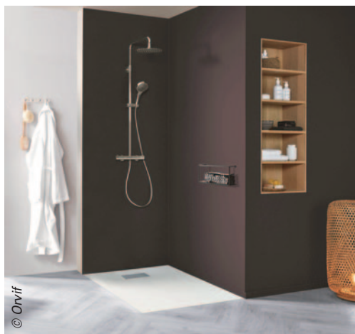
Le zéro ressaut Domao chez Orvif : un receveur céramique de 40 mm d'épaisseur