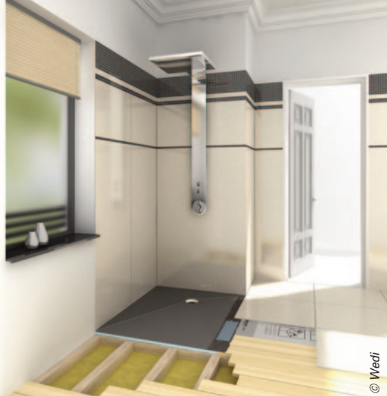
Comme tous les produits Wedi, Fundo Ligno Plus garantit une étanchéité parfaite.

Le confort est assuré grâce à une pomme de douche orientable avec jet pluie agréable et enveloppant, adapté à toutes les morphologies.