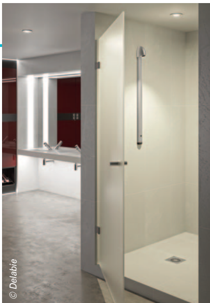
La colonne de douche Sporting Secuitherm de Delabie : hygiénique, esthétique, simple à installer et à entretenir.