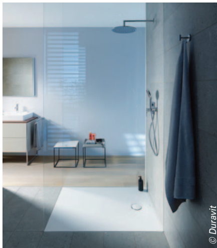
Les atouts de Tempano de Duravit : un design épuré à l'extrême avec une bonde de finition blanche, tout comme le receveur, et un grand confort pour les pieds des utilisateurs.

C'est un équipement apparent, très facile à installer qui se décline en plusieurs versions : arrivées d'eau apparentes pour raccorder par le haut devant le mur ou arrivées d'eau encastrées afin de raccorder derrière le mur (par le haut ou par le bas). La maintenance est simplifiée avec un accès direct aux filtres et aux clapets antiretour. Les robinets d'arrêt sont intégrés.