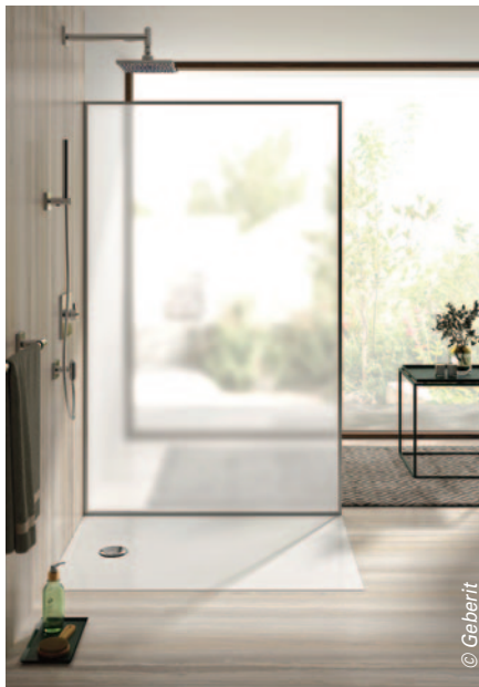
Depuis l'année dernière, est venu s'ajouter à la gamme, Renova Plan, d'une épaisseur de 35 mm seulement (le plus mince des modèles en céramique sur le marché !). Il permet une pose de plain-pied dans le neuf, conformément à la réglementation « zéro ressaut » grâce au kit d'étanchéité périphérique qui lui est associé.