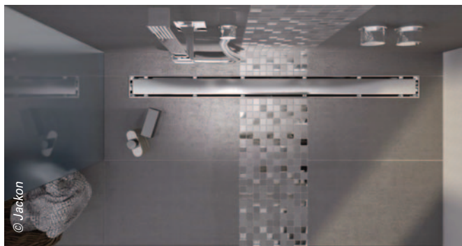
Aqua Line Pro de Jackon : un caniveau et une grille en acier inoxydable à surface plane autonettoyante.