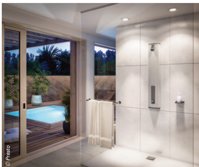
Prestotem 2 Sensor de Presto : un design qui s'adapte à tous les types de sanitaires collectifs.

sûres pour les salles de bains. Wedi répond à cette demande avec Fundo Ligno Plus, pour intégration en plancher bois.