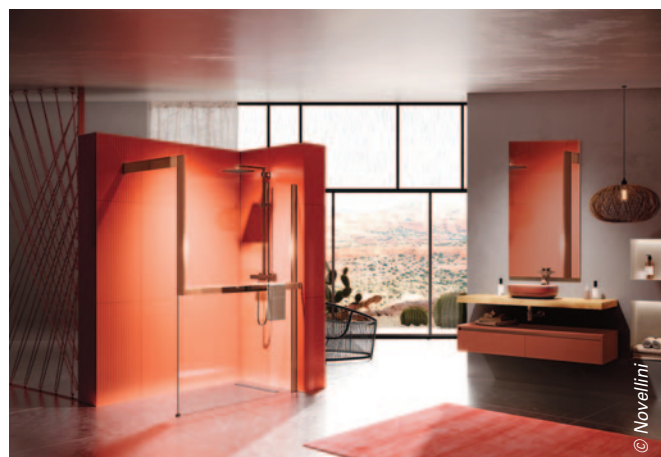
Les parois de douche walk-in Kuadra H Frame de Novellini existent en trois versions : avec étagère porte-objets à l'intérieur de la douche, avec le porte-serviette à l'extérieur de la douche, avec l'étagère intérieure et porte-serviette extérieure.

Leurs atouts : un panneau léger pour installation facile, un indice de réparabilité compris entre 7,3 et 9,8 selon les modèles et une seule DL 400 E Touch ou DL 400 E Sensor suffit. En effet, si plusieurs DL 400 SE sont installées en série, une seule DL 400 E Touch ou DL 400 E Sensor installée en bout de réseau permettra de purger l'ensemble du réseau d'eau !